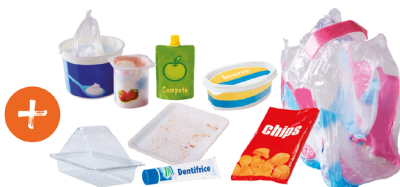
Pots, gourdes, tubes, sachets et films en plastique, barquettes en plastique et en polystyrène...