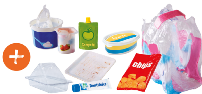
Pots, gourdes, tubes, sachets et films en plastique, barquettes en plastique et en polystyrène...