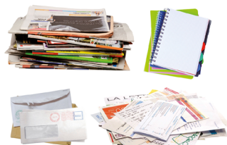
Journaux, magazines, publicités, enveloppes, courriers, cahiers...