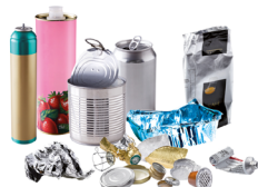
Emballages métalliques y compris les petits