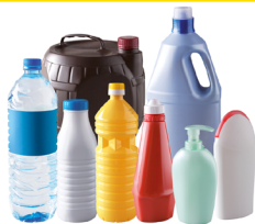
Bouteilles et flacons en plastique

TOUS LES EMBALLAGES ET LES PAPIERS SE TRIENT !