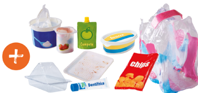
Pots, gourdes, tubes, sachets et films en plastique, barquettes en plastique et en polystyrène...