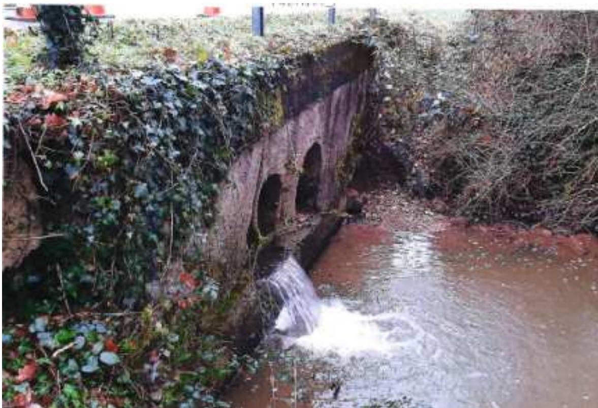
Seuil du pont de la Chassaigne (Palinges)